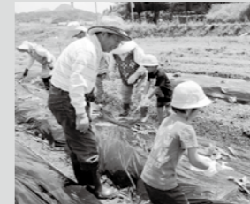
白寿会の皆さんとの交流

「あかるく なかよく げんきよく」 ～あそびがすき ともだちがすき えがおいっぱい おかのっ子～ ○おもいやりのある子 ○かんじて表現する子 ○のびのびと行動できる子