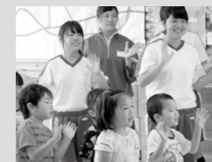
篠山産業高校生との交流