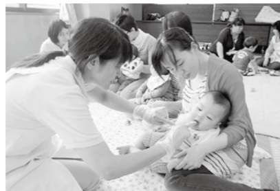
赤ちゃんのお口の中を歯科衛生士さんに見てもらいます

講師 兵庫県歯科衛生士会歯科衛生士、地域活動衛生士 対象 4カ月～1歳未満の子どもと保護者 定員 20組(先着順) 持ち物 仕上げ磨き用歯ブラシ、タオル、お茶 申込期限 8月17日(水) 申し込み たんなん子育てふれあいセンター(☎594-1040)