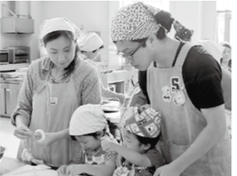
野菜を型抜きで切ったり、ポキポキ折ったりして、おいしみそ汁を作りましょう

講師 丹南・今田いづみ会 対象 2歳~就学前の子どもと保護者 定員 20組(先着順) 参加費 1家族600円(大人1食、子ども1食)、追加1食300円 持ち物 エプロン、三角巾、タオル、お茶、箸、上靴(すべて親子とも) 申込期限 2月3日(金) 申込先 たなんん子育てふれあいセンター(☎594-1040)