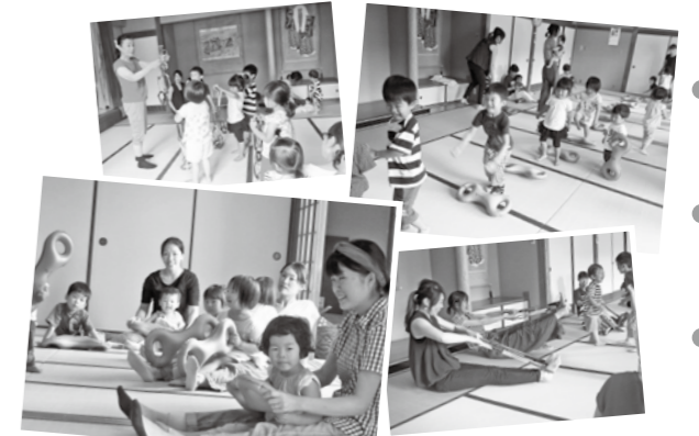
3B体操(3B=ボール、ベルター、ベル)で親子運動を楽しみました。お母さんもリフレッシュできました