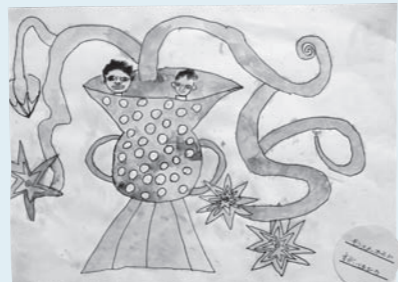
絵画「まほうの花(モンスターゴールド)」