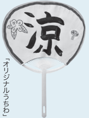
「オリジナルうちわ」