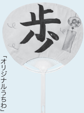
「オリジナルうちわ」