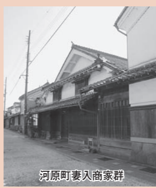
河原町妻入商家群