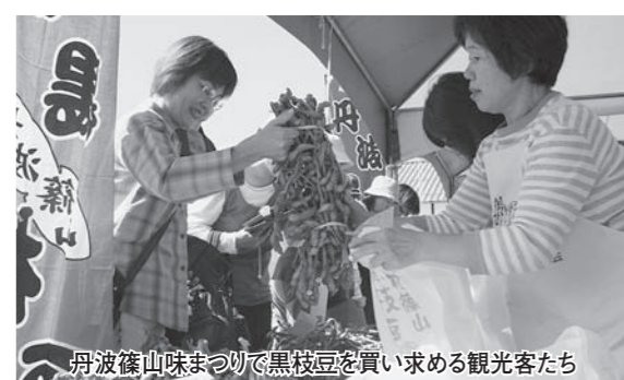
秋の味まつり(10月6日~8日・13日~14日) 市内の各地域(篠山城跡、城東支所、四季の森生涯学習センター、草山温泉・観音湯など)で、秋の味まつりが行われました。各会場では特産品のふるまいなどが行われ、観光客たちは黒枝豆をはじめとする丹波篠山の秋の味覚を堪能していました。