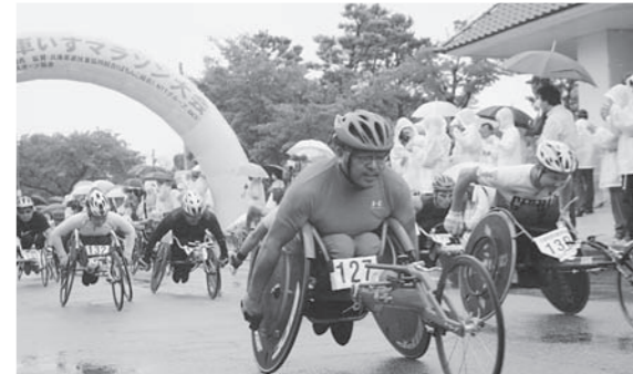
第19回全国車いすマラソン大会(9月30日) 第19回「全国車いすマラソン大会」が篠山城跡マラソンコースで行われました。雨天の中、全国から集まった約110人の選手たちが、初秋の丹波篠山路を疾走。市内中・高校生などのボランティアスタッフや沿道からは、温かい声援が送られていました。