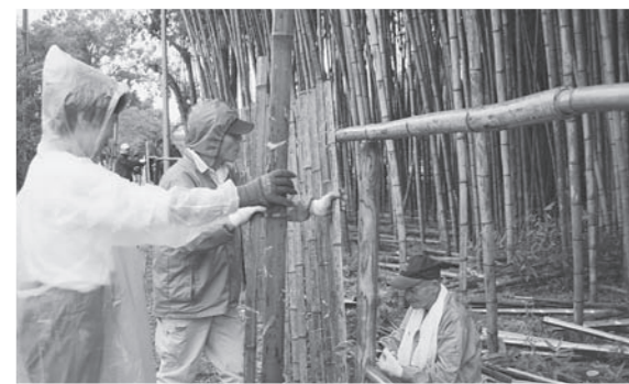
南新町竹林整備事業(9月30日) 「南新町美しいまちづくりの会」や、まちづくり篠山、篠山市商工会青年部などの皆さん、約60人が築城400年に向けて、篠山城跡南側の竹林の整備を行いました。同活動は今年4月から行われてきたもので、参加された皆さんは、倒れ込んだ竹を伐採し、竹を格子状に組み合わせて垣根を作りました。