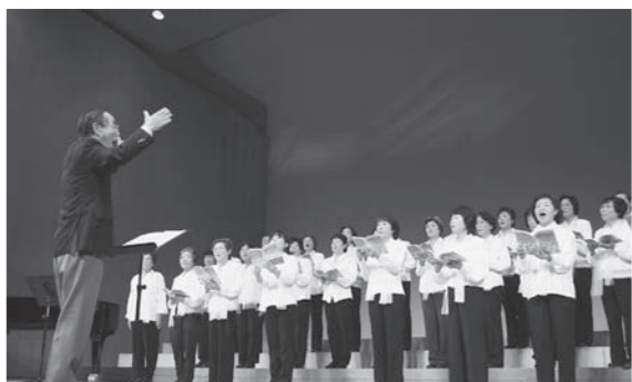
丹波篠山童謡・唱歌まつり(3月9日)

いいとこみつけ「ホットたんば篠山ステーション」が、JR篠山口駅で行われました。これは、関西学院大学の学生と商工会、市民の皆さんが共同で開催した駅活性化のイベントで、カフェやフリーマーケットには、多くの駅の利用客らが訪れていました。