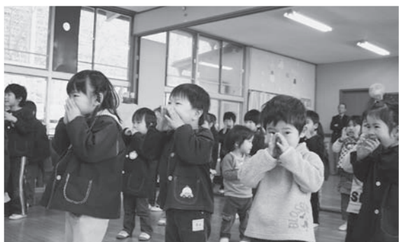
丹波地区「QQ体操キャラバン」(3月5日)

ラジオ関西主催の丹波地区「QQ体操キャラバン」が城南保育園で行われました。QQ体操は子どもたちの防災意識を育むため、防災に役立つ救命救急の動きを取り入れた独自の体操。園児たちは、訪れたキャラバン隊の皆さんと一緒に元気に踊りました。