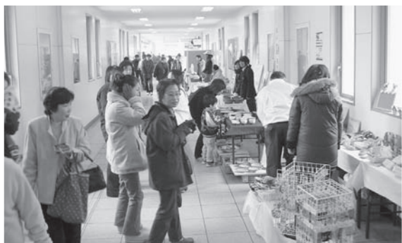
ホットたんば篠山ステーション(3月8日・9日)

ラジオ関西主催の丹波地区「QQ体操キャラバン」が城南保育園で行われました。QQ体操は子どもたちの防災意識を育むため、防災に役立つ救命救急の動きを取り入れた独自の体操。園児たちは、訪れたキャラバン隊の皆さんと一緒に元気に踊りました。