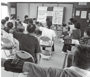
最近立ち上がった「上宿いきいき倶楽部」みんなでデカボー体操

て、皆で実践しています。現在、立ち上げ予定も含め、市内35カ所で開催されています。始めて2年以上継続している地域もあり、「毎回楽しみ」にしている「足腰が軽くなつて、杖がいらなくなった」「背筋が伸びて若返った」など、うれしい声が聞こえています!