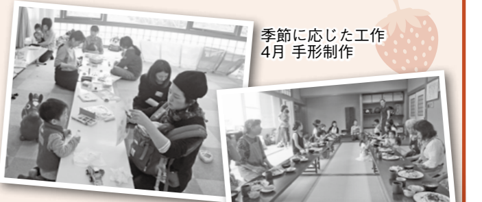
季節に応じた工作 4月 手形制作

0歳～未就学児の親子が集まり、子育てグループを運営しています。地域でお友だちづくりをしませんか? 現在、センターに登録して活動している子育てグループは9つあります。詳しくはお問い合わせください。 ささやま子育てふれあいセンター☎556-2100 たんなん子育てふれあいセンター☎594-1040