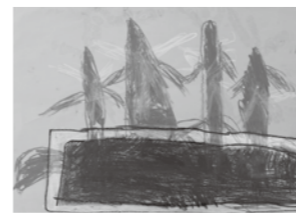
絵画 「ぼくのとうもろこし」

育てたとうもろこしの絵です。くきを大きく太く描きました。ひげの部分がむずかしかったです。