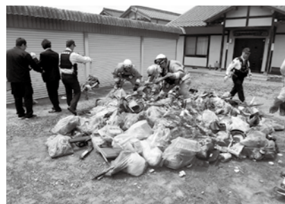
市内でもごみ収集車で火災が発生(平成29年5月)

これからの送別会、歓迎会シーズンでの30・10運動の実践にご協力をお願いします。