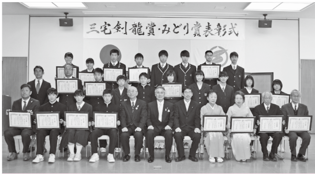
芸術・文化の高揚と教育の発展に貢献された方をたたえる三宅剣龍賞・みどり賞の表彰式を2月11日、四季の森生涯学習センターで行いました。受賞された方は次の皆さんです(敬称略)。おめでとうございます！