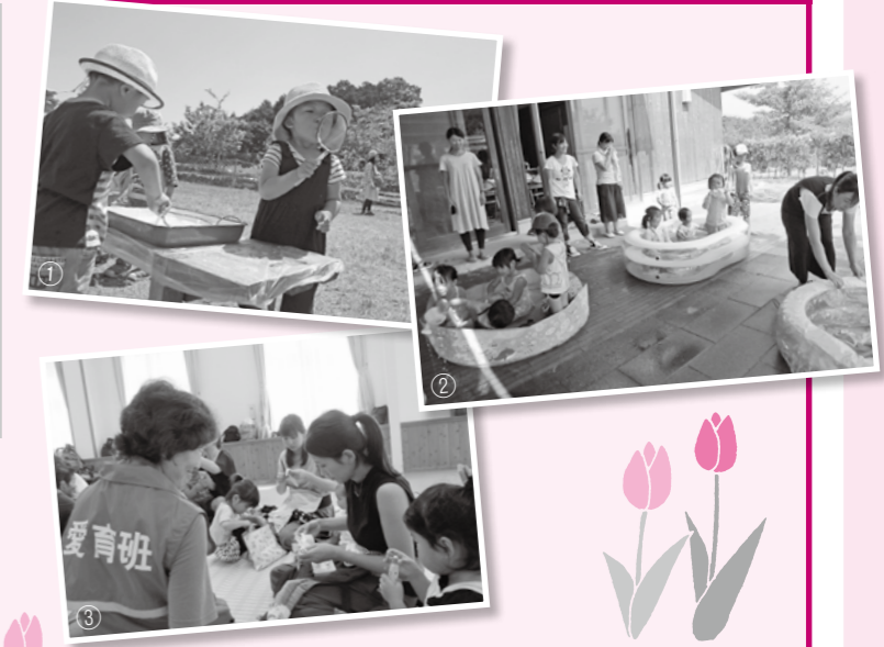
①公園でシャボン玉を作って遊びました ②プール遊び。冷たい水が気持ちいい! ③七夕会。愛育班さんと一緒に七夕飾りを作りました

子どもたちとの関わりを大切に、情報交換や親子のリフレッシュの場となるサークルです。季節の活動や遊びを通して、みんなで楽しみましょう! 気軽に参加してくださいね! 主な活動場所 四季の森生涯学習センター 主な活動日 月1~2回(月または火曜日) 年会費 1家族200円