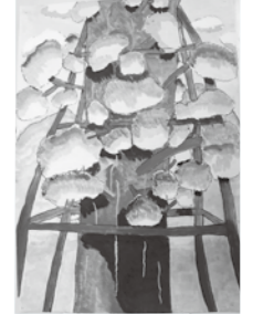
絵画 「大山がほこる千年モミ」

トントンぬりで全体を仕上げました。光が当たっているように見せるために、葉っぱに影をつけ工夫しました。