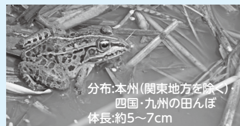
分布:本州(関東地方を除く) 四国・九州の田んぼ 体長:約5~7cm