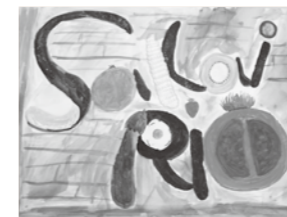
絵画 「ちょこっと野菜と果物」

自分の名前のローマ字に合う形の野菜と果物を並べてみました。トマトの中身を描くのは難しかったのですが、ミカンのオレンジの線はうまく描くことができました。