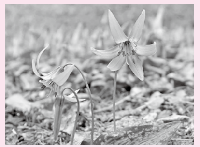
カタクリ(カタクリ科)

カタクリの群生地が隣の丹波市氷上町にあることはよく知られている。篠山市にもわずかにあるがあまり知られていない。栗林にあるが少ないので目立たない。カタクリは名が示す通り根からカタクリ粉ができるが、昔は量が少なかったので病人の滋養として葉草扱いにされていた。現在のカタクリ粉はジャガイモから多量に作られる。カタクリはやや寒い地方に群生地が多くあり、早春の花として見事な美しい花畑になる。花のかれんに咲く姿が傾いた籠に見えるので古名の「かたかご」とも、食用にする根の鱗片が栗の片割れに似るのが語源とされている。兵庫県絶滅危惧種に指定されている。