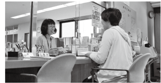
開設時間 8:30~17:15 ところ 丹南健康福祉センター

健やかに安心して妊娠期間を過ごし、出産から子育てができるよう総合相談窓口・子育て世代包括支援センター「ふたば」を開設しています。母子保健コーディネーター(保健師・看護師など)が中心となり、さまざまな悩み・相談に対応します。関係する機関