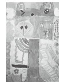
絵画 「茶色うさぎのツリーハウス」

だいすきなウサギをイメージしたツリーハウスをかきました。ベランダにあるブランコやかいだんは上手にかくことができ、気に入っています。