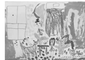
絵画 「サラダでげんき」

おはなしにでてくる動物たちがサラダをもってきてくれたところです。サラダはげんきが出そうな、カラフルな色でぬりました。