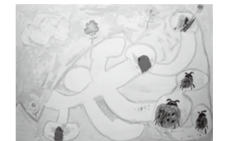
絵画 「どうぶつとこんちゅうのせかい」

山にチョウやテントウムシ、モグラがすんでいるせかいです。チョウのようちゅうをかくのがむずかしかったですが、うまくできました。