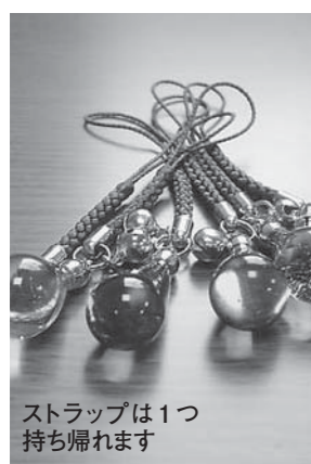
ストラップは1つ持ち帰れます

清掃センター ☎596・0844 とき 7月30日(月) / 31日(火) / 8月21日(火) / 22日(水) ※いずれも13時30分から約3時間。 ところ 清掃センター 内容 ガラスのストラップ作り 対象 篠山市と丹波市山南町に在住の小学生 定員 各回20人(教室は1回ごとに終了) ※6月1日(金)から電話受け付け(先着順、複数回の参加も可能)。 参加費 1回500円 ※大人向けは9月から開講予定。