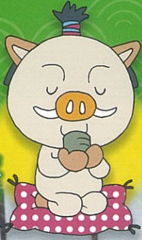
篠山市 マスコットキャラクター まるいの