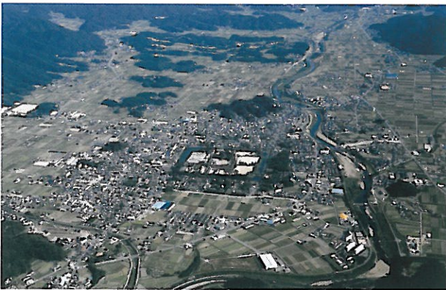
篠山城下町地区全景。周囲を田畑に囲まれ、北は多紀連山県立自然公園、南東部に篠山城下町形成前の拠点であった中世山城八上城跡を望み、現在も近世城下町の姿をよくとどめている

特に、地元の「NPO 法人町なみ屋なみ研究所」は活用されていない古民家の空き家の買い取りや 10 年間の無償賃借契約を結び、市民ボランティアによる修理を実施し、新たな担い手に売却、賃貸する民間ベースの保全の取り組みを行っていることは評価できる。また、近年は「丹波篠山・まちなみアートフェスティバル」、「ササヤマルシェ」、「丹波篠山ひなまつり」、「丹波篠山とつてもレトロな町歩き」、「古い町並みナイトウォーク」、「竹民具・竹玩具づくり」、「こどもスケッチ大会」等、町の活性化の試みが極めて活発であることも大きな特徴である。行政の取り組みに加えて、これらの市民活動によって市民が誇りを取り戻し、さらに「ターンや」ターンを含めて交流人口を増やしていることから、都市景観大賞にふさわしい地区と判断する。(卯月)