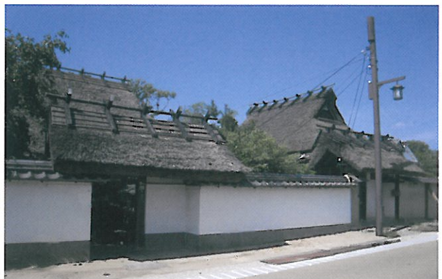
御徒士町武家屋敷群の町並み。茅葺きの武家屋敷が建ち並び、往事の面影が伺える。街路整備、電線類地中化、建築物や門・塀の修理修景が進み、近年では市民主体の竹林整備等の景観向上活動が行われている。