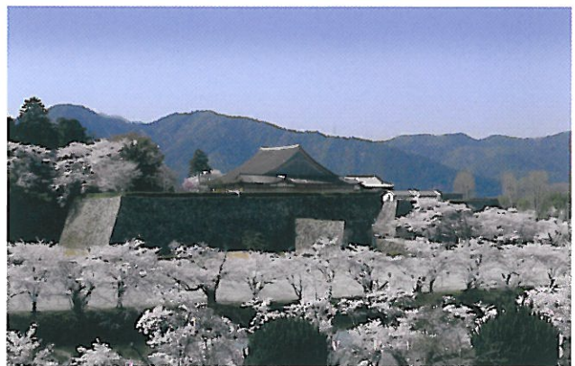
篠山城跡の景観。イベント等市民に親しまれる空間として活用されている。昭和 41 年度以降は石垣修理や史跡整備、公園整備が進められ、篠山市を代表する観光地となっている。