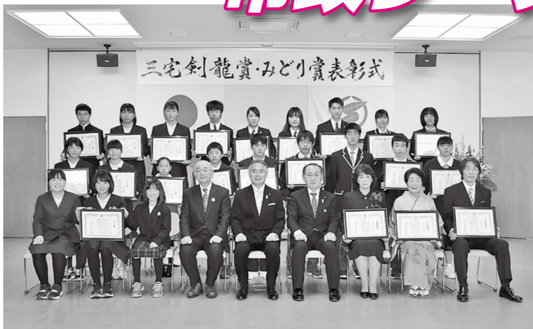
芸術・文化の高揚と教育の発展に貢献された方をたたえる三宅剣龍賞・みどり賞の表彰式を2月11日、四季の森生涯学習センターで行いました。受賞された方は次の皆さんです(敬称略)。おめでとうございます!