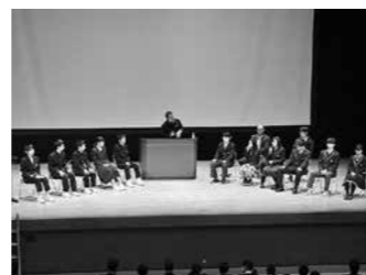
キャリア形成事業 ～夢プラン～