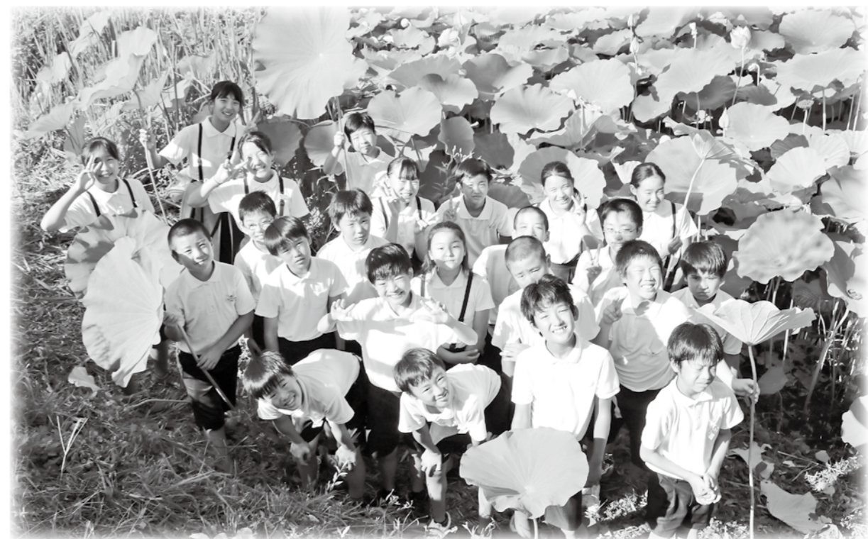
篠山城跡南堀のハス復活！地域とともに取り組んだ篠山小児童