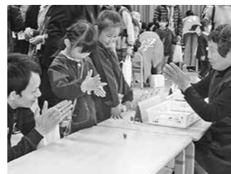
どんぐりマーケット(大山幼)