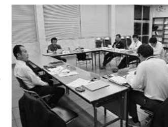
学校運営協議会(今田中)

保護者や地域住民等で構成する学校運営協議会を中心に、学校・保護者・地域がともに協働しながら、地域の中にある学校として、地域に信頼される学校づくりを推進します。