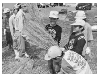
篠山産業高校との農業体験 (岡野小)