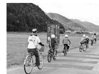
自立活動 自転車でお出かけ (城南小)

発達障害及び知的障害のある幼児に対し、適切な早期支援を行うための個別発達支援、交流及び共同学習を通じた発達支援を行うため、早期発達支援室を設置し、個々の成長及び円滑な就学期への移行を促していきます。