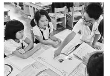
グループでの話し合い活動(城北畑小)

相手の状況や気持ちを考えた適切なコミュニケーションのあり方、個人情報的重要性、肖像権や著作権等の知的財産権、情報発信に伴う責任、トラブル回避の方法、長時間のインターネット利用による心身の健康への影響等について、児童生徒が自ら判断し、考える学習活動を充実させ、学校と家庭が連携して情報モラルを育成します。