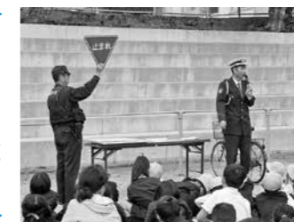
交通安全教室(古市小)

安全管理、安全教育、組織活動を通して未然防止、救急対応に係る校内体制を充実し、安全で安心な学校づくりを推進します。また、子どもたちが安心して学校生活が送れるように、令和2年度は各園に防犯カメラを設置します。