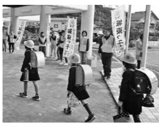
朝のあいさつ運動(城東小)

学校・家庭・地域が連携した啓発・実践活動に継続して取り組み、日頃からあいさつが交わせる、明るく温かいまちづくり、学校づくりをめざします。