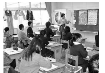
韓国の歴史と文化を学ぶ(多紀小)