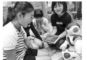
ロボットプログラミング体験教室(大山小)