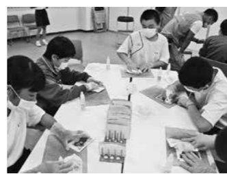
写真修復ボランティア (篠山中)