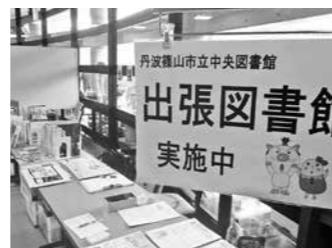
ハートピアセンターでの出張図書館

「図書館ビジョン」に基づき、あらゆる世代に応じた図書館事業をボランティア等との協働によって推進します。「丹波篠山に住もう帰ろう運動」の支援として、就業支援や生活支援、行政支援に関する資料を積極的に収集し、情報発信に努めます。