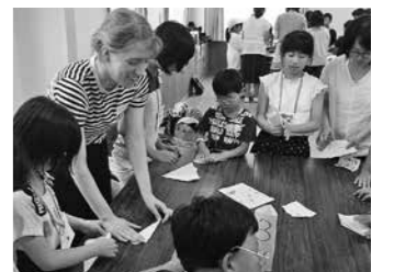
イングリッシュ・デイ・キャンプ