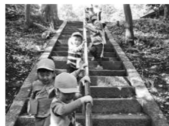
体幹づくり(味間こども園)

全ての公立保育園・幼稚園・こども園において、体幹づくりを意識した保育を実施します。