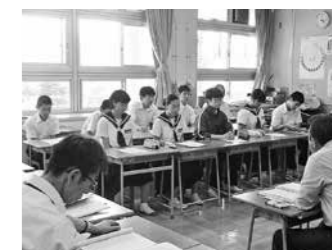
生徒を交えた学校運営協議会 (西紀中)