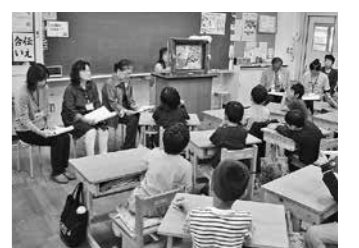
地域の方を招いての人権教室(西紀南小)