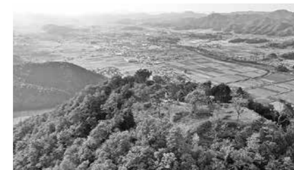
八上城跡の伐採整備

「歴史文化まちづくり資産」を総合的に保存・活用するため、「文化財保存活用地域計画」を策定します。また、地域の歴史文化を活かした取組に対する助成を充実します。