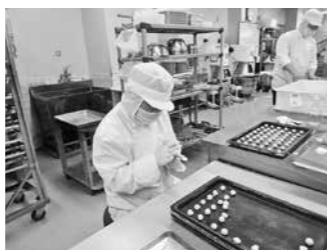
現場・施設実習(篠山養護)

目標を持ち、具体的な計画をたて、それに向かって進んでいく力(キャリアプランニング能力)をはじめ、コミュニケーション能力や課題対応能力など、自立した社会人・職業人として将来に必要な能力の育成をめざすキャリア教育の支援に、家庭や地域との連携のもと取り組みます。