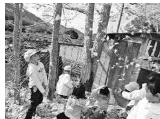
葉っぱのお風呂屋さん(今田幼)