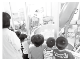
学校給食センター見学 (西紀きた幼)