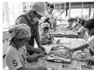
クッキングの時間(城南幼)

公立・私立全ての保育園・幼稚園・こども園において、丹波篠山の自然を活かしながら市民みんなで子どもたちの育ちを支えていることについて、分かりやすく示し、共有できるように「丹波篠山市幼児教育コンセプトブック」を作成します。