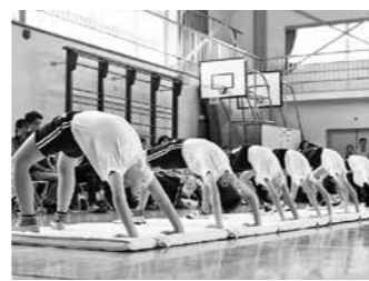
体育発表会(西紀北小)

児童生徒の運動能力の向上と体力づくりへの関心・意欲を高めるとともに、体力の状況を把握・分析し、学校における体育・健康に関する指導などの改善を図ります。