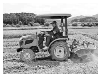
農業体験(篠山東中)