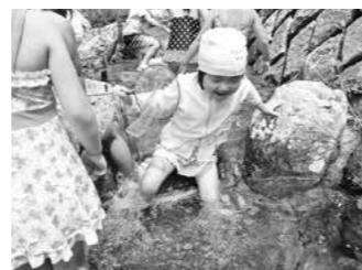
川遊び(かやのみ幼)

諸感覚(触覚、視覚、聴覚、嗅覚、味覚)の中でも最も原始的な感覚である触覚の発達に向け、粘土遊び、水遊び、砂遊び、泥遊び等を全ての公立保育園・幼稚園・こども園において実施します。