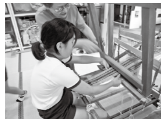
丹波木綿づくり(西紀小)

学校給食センターと学校・家庭・地域とが連携して食育の推進に取り組みます。全国学校給食甲子園での優勝は、農都・丹波篠山を全国にアピールすることができました。これからも日本一の給食献立を維持できるよう努めるとともに、優勝献立のレシピを公開し、丹波篠山食材を広く周知します。