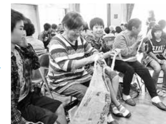
さぎそう学園と今田小の連携事業

高齢者一人一人の生きがいづくりの場を提供するとともに、受講生の意見を反映させ、魅力ある講座を開講します。また、オープン講座の取組など、高齢者大学全学園と小学生などが交流できる環境づくり、機会づくりを進めます。