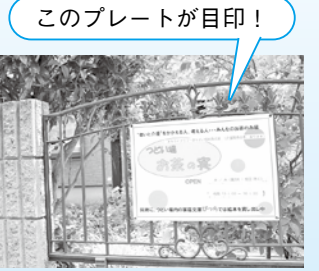
このプレートが目印!