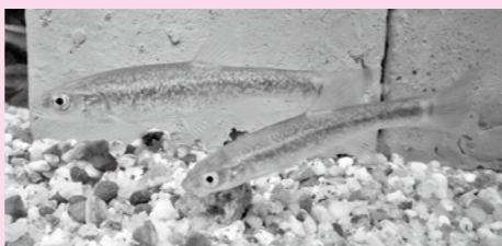
分布: 富山県・静岡県以西の本州、四国、九州、五島列島、対馬 全長: 約10cm