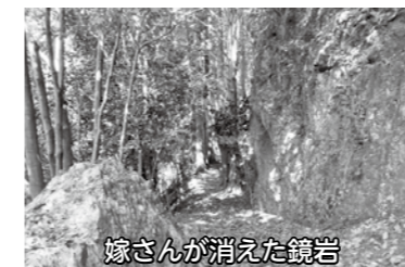
嫁さんが消えた鏡岩