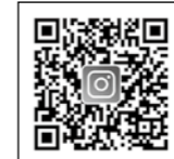
公式インスタグラム

商工観光課 ☎552・6907 工観光課で運営しているインスタグラムのアカウトになりすまして、偽アカウントが見つかっていない。偽アカウントからのメッセージの誘導により、個人情報抜き取りなどの被害を受ける恐れがありますので、ご注意ください。