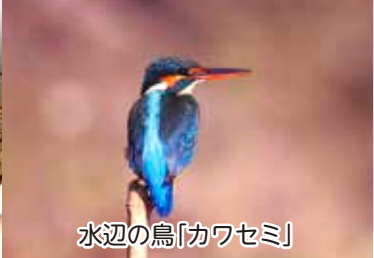
水辺の鳥「カワセミ」