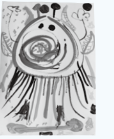
絵画 「うちゅう人クラゲ」

いろいろな色を使って描きました。色塗りを頑張りました。クラゲの下にあるのが宇宙人の骨で、クラゲの手には武器があります。塗りつぶした丸は宇宙人です。