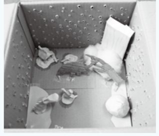
工作 「のぞいてみると」

箱の側面に小さな穴を空け、ライトで照らしてのぞき穴から中を見ます。ゴジラやカブトムシ、おばけやでっかいおにぎりなど、好きなものを詰め込みました。