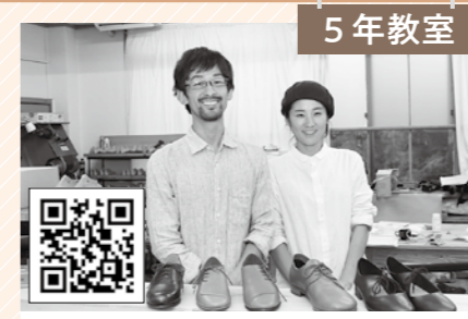
5年教室 handmade shoes "Nelio"ネリオ オーダーメイドの靴屋。デザインや革の色を選び、セミオーダーからフルオーダーまで手掛けられています。