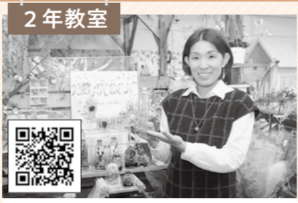
2年教室 K's GARDEN ハンドメイド教室、ハンドメイド雑貨屋。全国から38人の作家さんの個性あふれる手作り品が並んでいます。