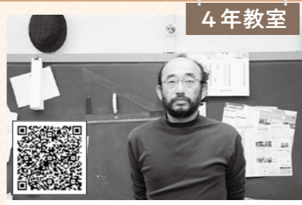
4年教室 学習スタジオSTEP 篠山東部地域の小・中・高校生のための英語と数学の教室です。大人のための俳句教室もあります。