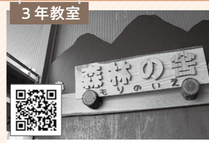
3年教室 森林の舎(もりのいえ) 丹波地域の「杉・檜」の間伐材や広葉樹(一部)を使用し、天然木を生かした安全で安心なおもちゃや小物を製作されています。