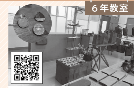
6年教室 革工房mimi オリジナルデザインのフルオーダー・セミオーダーで、革バッグなどを製作。手縫いのキーホルダーやバッジもキュートです。