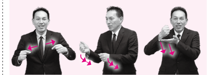
日本 農業 遺産

両手2指を向き合 わせ、左右に引き 離しながら閉じる 両手拳を前後に離 して並べ、同時に 振り下ろす動作を 繰り返す 左手掌の上方に右 手拳を置き、右か ら胸の正面へ下す