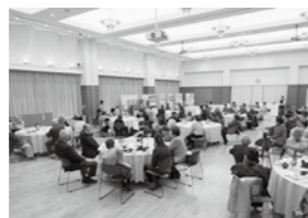
↑平成30年度 親睦研修会

芸能の部、展示の部合わせて21の団体から構成されています。毎年3月に開催する「親睦研修会」では各加盟団体が一堂に集まり各団体同士の連携を深める会合も行っています。