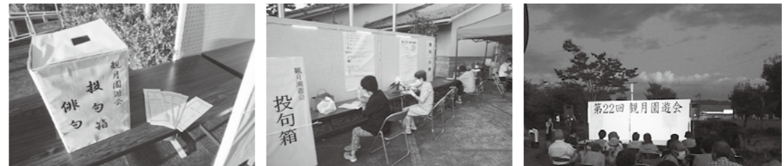
第22回 観月園遊会の様子