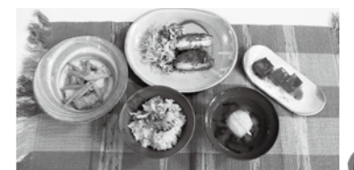
↑令和3年度 伝承・応用コース