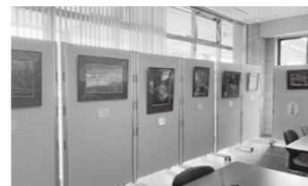
↑令和3年度 西紀支所ロビー展示

現在8団体の加盟があり、西紀支所のロビーにて作品展示も行っています。また文化祭の実行委員としても参加しており、西紀地区を盛り上げる一翼を担っています。