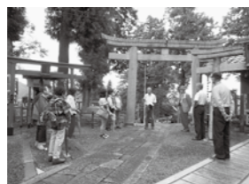
↑平成30年度 再発見ツアー

最大時、31の加盟団体がありましたが、近年では、17団体に留まっています。芸術や芸能に留まらず、研究調査、学術といった分野にまで広く加盟団体を募集しています。