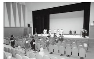
↑令和2年度 芸能発表会

今田地区を中心とした12団体で構成されており、秋の芸能発表会などを中心に日々仲間たちとともに芸能や文化活動に取り組んでいます。興味のある方はぜひご参加ください。