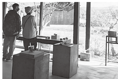
クラフトヴィレッジ