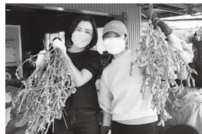
黒枝豆の作業に全日空(ANAグループ)の皆さん

城下町のたたずまい、田園景観は心なごませます。立杭、福住、西紀北などにもぎわいを見せました。