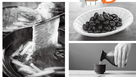
ふるさと納税の目玉商品