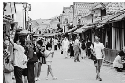
河原町のにぎわい