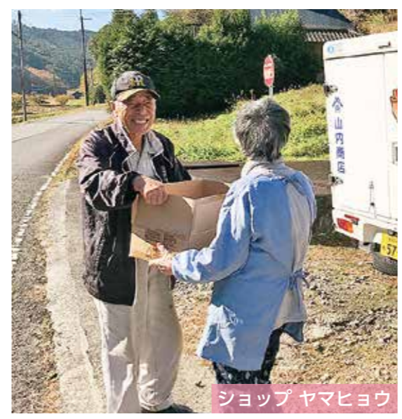
ショップヤマヒョウ

問い合わせ 地域振興課 ☎552-5112 / 城東支所 ☎556-3111 / 多紀支所 ☎557-1161 / 西紀支所 ☎593-1111 丹南支所 ☎594-1131 / 今田支所 ☎597-3111