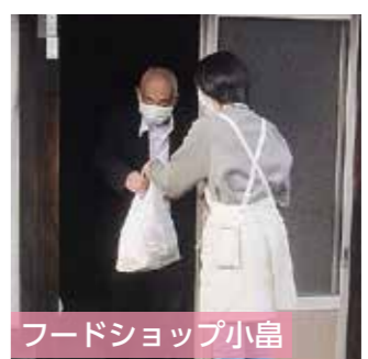
フードショップ小島