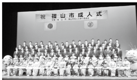
↑昨年度の新成人集合写真