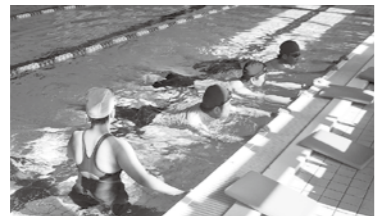
↑リーダー研修の様子

水辺の環境学習や、安全教室を行いたいけれど専門のスタッフが身の回りにいないときは、公民館にお問い合わせください！充実した教室をご用意いたします！