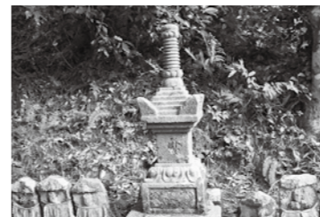
式部を偲ぶ供養塔