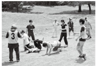
↑無邪気にはしゃぐ参加者たち