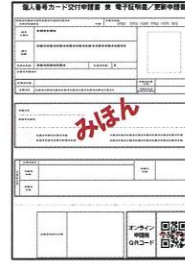
QRコード付交付申請書