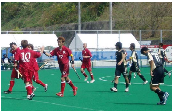
▲競技別リハーサル大会として全日本社会人選手権大会を開催