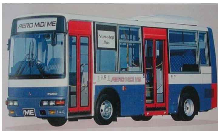
▲コミュニティバスのイメージ