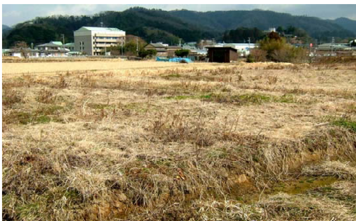
▲西部給食センター建設予定地