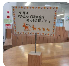
窓口飾りつけたメッセージ