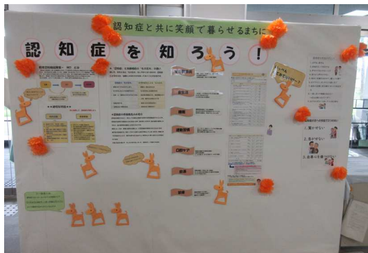
市役所第2庁舎1階ロビー