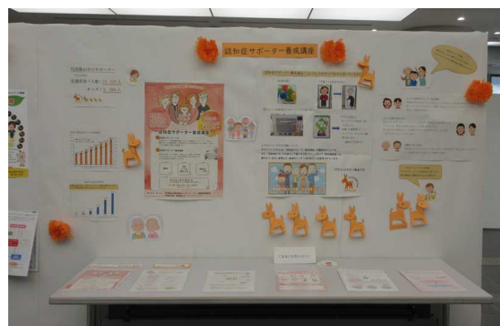
市役所本庁1階ロビー