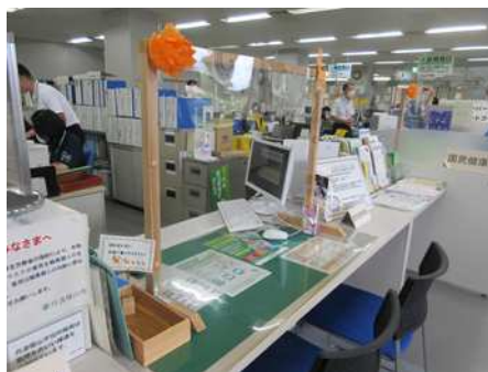
市役所窓口飾りつけ