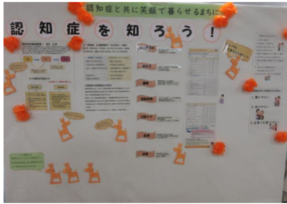
市役所第2庁舎1階ロビー