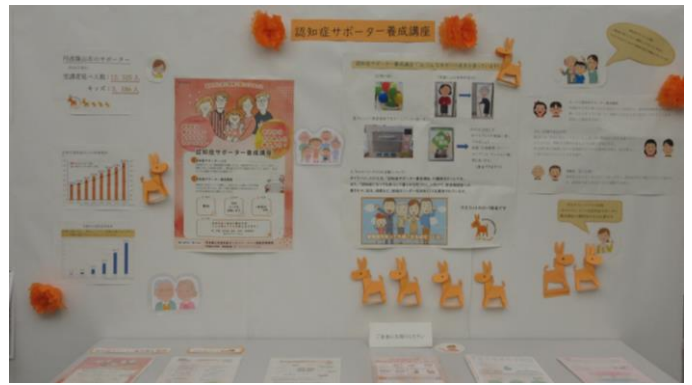
市役所本庁1階ロビー（市内の高校による展示）