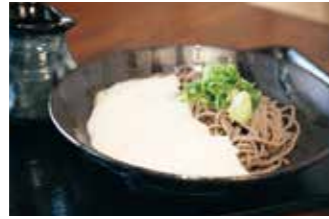
篠山皿そば 武拾六 ②

【価格】1,815円 【所】丹波篠山市二階町56 【時】11:30～売切れ次第終了 【休】木 【問】079-552-5965