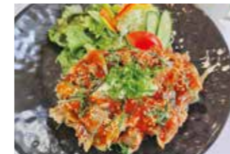
大正ロマン館(カフェレストランマルコッテ) ⑩

【価格】4,400円 【所】丹波篠山市呉服町32 【時】11:00～14:00/17:00～21:00 【休】無休 【問】079-554-2266