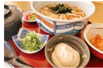
ユニピアささやま ⑤

【価格】1,750円 【所】丹波篠山市河原町160 【時】11:30～14:30/17:30～20:30 (予約可)蕎麦売切次第閉店 【休】日曜夜・月(祝日の場合は翌日)、年末年始 【問】079-552-2808