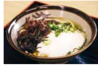
丹波篠山味処みたけ本店 ③

【価格】1,080円 【所】丹波篠山市黒岡19 【時】11:00～そばが売切れ次第終了 【休】火 【問】079-552-6295