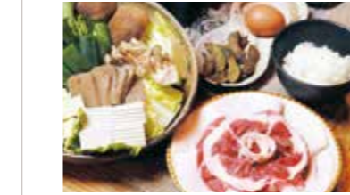
丹波篠山囲炉裏料理 いわや ⑮

一人鍋山かけぼたん(冬季) 【価格】650円(地卵と山の芋の出し巻きたまご)、620円(山の芋のポテトフライ)、2,000円(一人鍋山かけぼたん(冬季)) 【所】丹波篠山市中野76-4 ホロンピアホテル5F 【時】17:00～23:00(L.O.22:30) 【休】不定休 【問】079-594-2767