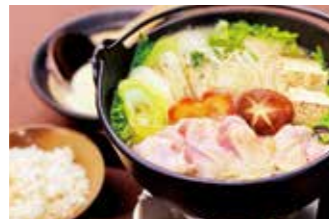
りょうり舎やまゆ ⑧

【価格】1,700円 【所】丹波篠山市二階町71 【時】11:00～17:00売切れ次第終了(17:00以降はご予約にて承ります) 【休】不定休 【問】079-554-2777