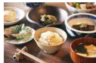
古民家の宿「集落丸山」 ⑪

【価格】1,700円 【所】丹波篠山市北新町97 【時】10:00～17:00(お食事は11:00～16:00) 【休】火曜日(その他臨時休業有り) 【問】079-552-6668