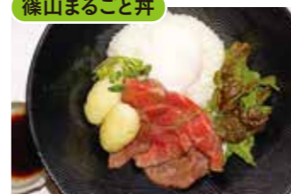
食事処 和多作 ㉒

【価格】1,500円 【所】丹波篠山市立町19 【時】11:00～17:00(16:00L.O) 【休】木(祝日の場合は翌平日) 【問】079-552-0011