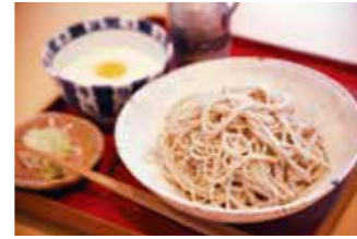
そば切り 花格子 ④

【価格】1,150円 【所】丹波篠山市黒岡683 【時】11:00～17:00 【休】不定休 【問】079-552-1385