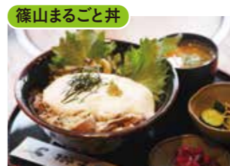
獅子銀 陶の郷店 ㉑

【価格】1,400円 【所】丹波篠山市黒岡70-1 【時】11:00～16:00(L.O15:30) 【休】水 【問】079-552-3386