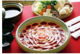
活魚割烹 宝魚園 ⑰

【価格】6,930円 【所】丹波篠山市火打岩495-1 【時】11:30～(要予約、最終来店18:30) 【休】木曜(4月～9月)、不定休(10月～3月)、年末年始 【問】079-552-0702