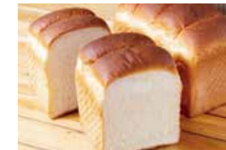
Bakery HikoOKI ㉒

【価格】1,320円 【所】丹波篠山市今田町上立杭3 【カーナビ】「丹波伝統工芸公園陶の郷内」で入力 【時】10:00～17:00 【休】火 【問】079-597-2173