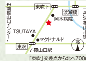
「東吹」交差点から北へ700m

7/27(土)・7/28(日) おもちゃすくい 1回200円 ※なくなり次第終了 随時、フランクフルトの販売あり