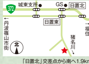
「日置北」交差点から南へ1.9km