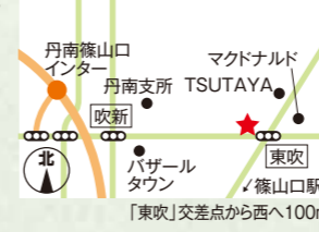
「東吹」交差点から西へ100m