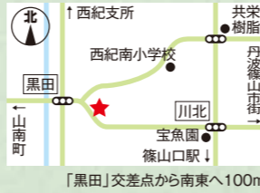
「黒田」交差点から南東へ100m