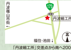
「丹波細工所」交差点から南へ200m