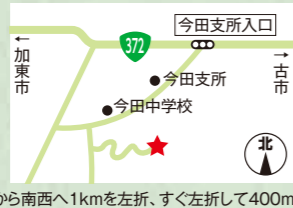
「今田支所入口」交差点から南西へ1kmを左折、すぐ左折して400m