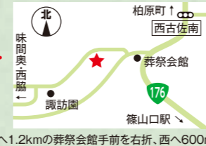
「西古佐南」交差点から南へ1.2kmの葬祭会館手前を右折、西へ600m