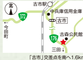
「古市」交差点を南へ1.6km