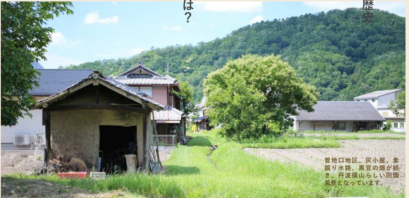
曾地口地区。灰小屋、素掘り水路、黒豆の畑が続ぎ、丹波篠山らしい田園風景となっています。

まほろばとは古事記の中で歌われた言葉で、「素晴らしいところ」「住みやすい場所」という意味です。自然豊かな田園風景が魅力である丹波篠山では、過去から大切にしてきた水路を環境に配慮した形で未来に引き継ぎましょう。