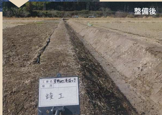
(令和3年度 草野地区排水路浚渫工事)

雑草の繁茂や土砂の堆積によって通水性が低下した排水路において重機で再度、素掘り水路として整備した事例