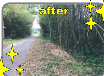
▲竹粉碎機で竹が撤去でき、 こんなにスッキリ！チップは その場に撒いて下草抑えに。