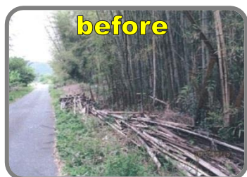
▲伐採した竹が積まれたまま で荒れている印象。景観も×。

チップにすれば容積が減って竹の処分がしやすくなり、さまざまな用途に活用できます。